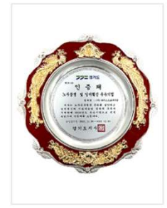
2021년 노사상생 및 일터혁신 우수기업 인증