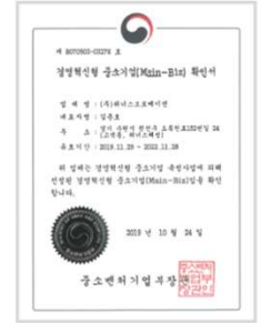
경영혁신 중소기업 확인서