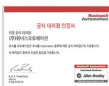
RA 공식대리점 인증서 (국문)