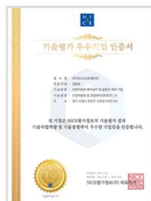
나이스 TCB 기술평가우수기업 인증서