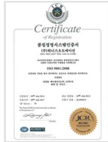
ISO 9001 품질경영시스템 인증서

품질경영시스템인증서 ISO 9001, 환경경영시스템인증서 ISO 14001 등 다수의 인증서와 특허를 보유하여 고객의 신뢰를 얻고 있습니다.