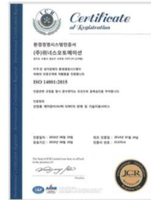
ISO 14001 환경경영시스템 인증서