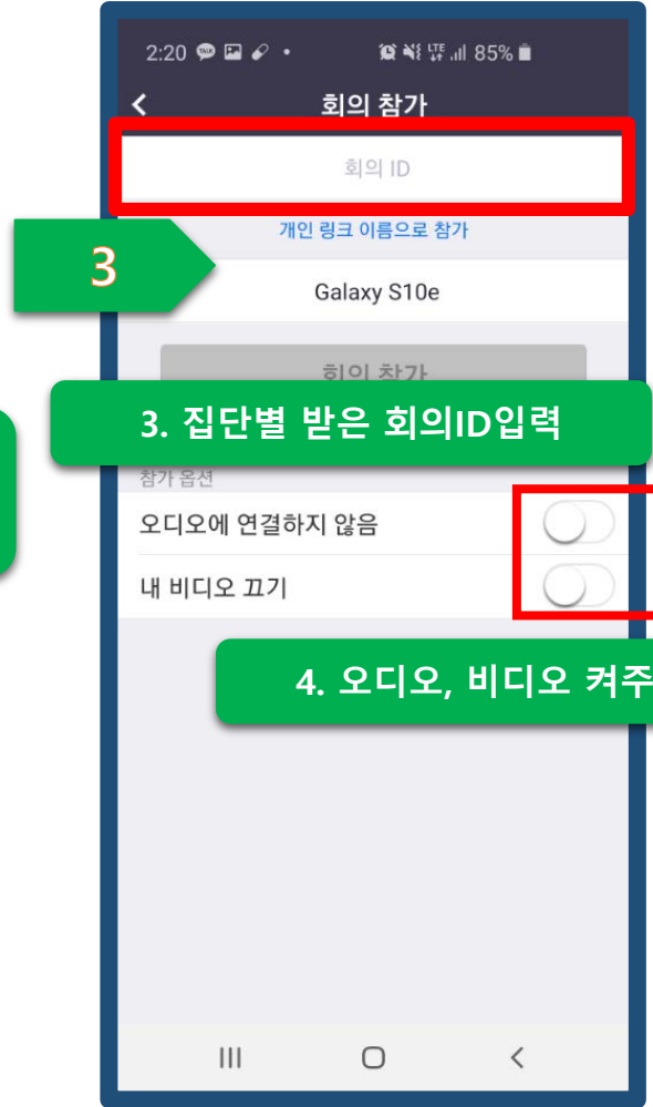
3. 집단별 받은 회의ID입력