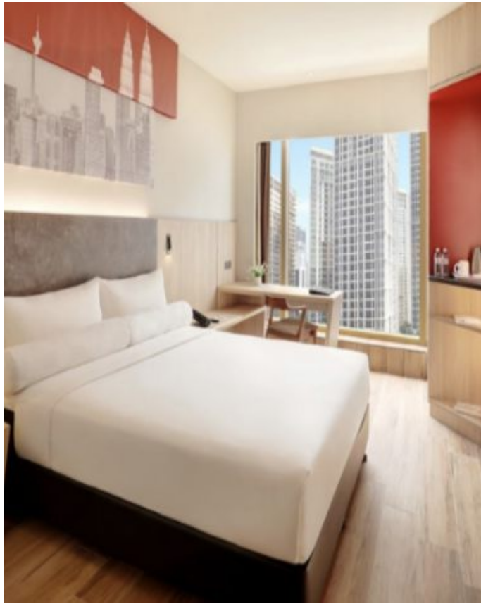
기숙사/ 호텔 등