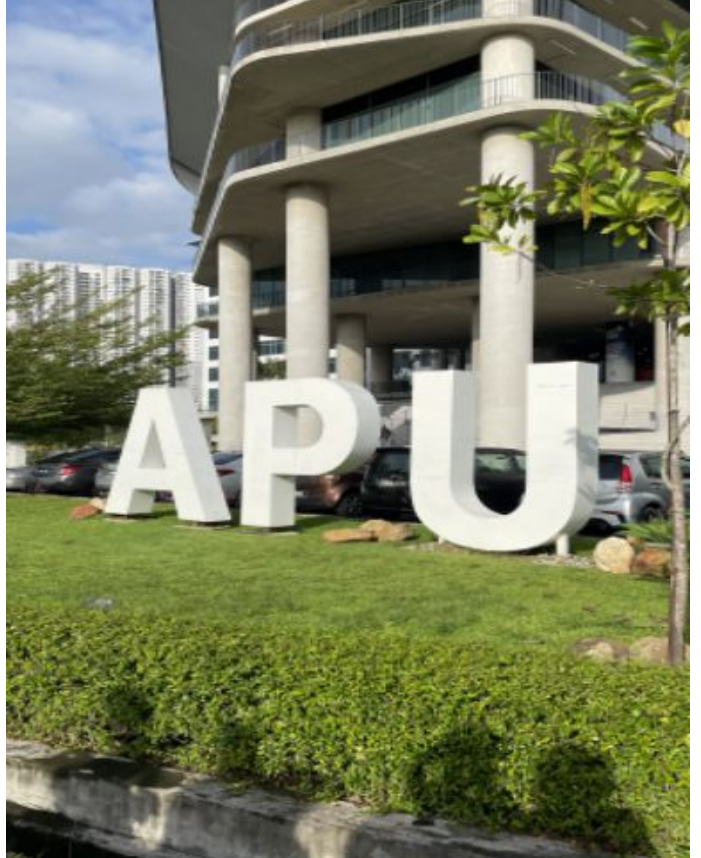
학교 캠퍼스/ 시설