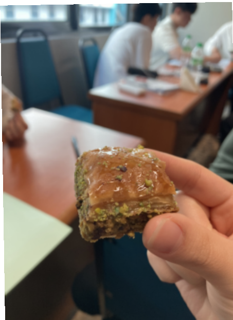
튀르키예 전통간식 'Baklava'