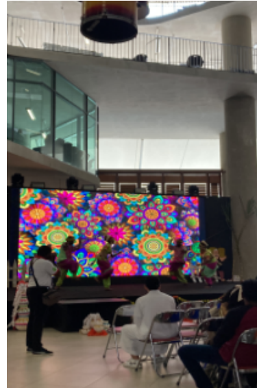
학교 내 G 층 무대에서 진행된 전통 춤 행사