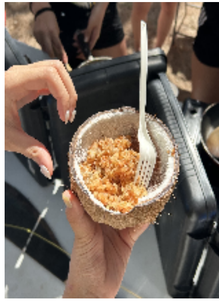
코코넛 과육과 물