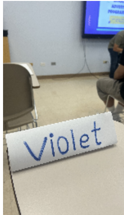
영어 이름 만들기