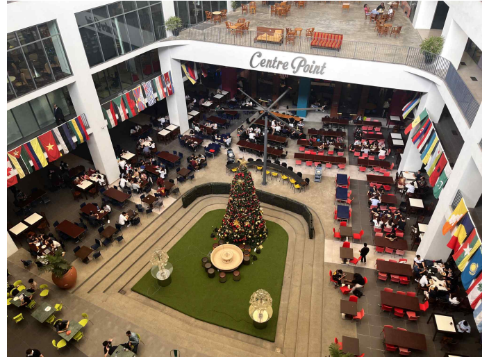
학교 캠퍼스/ 시설