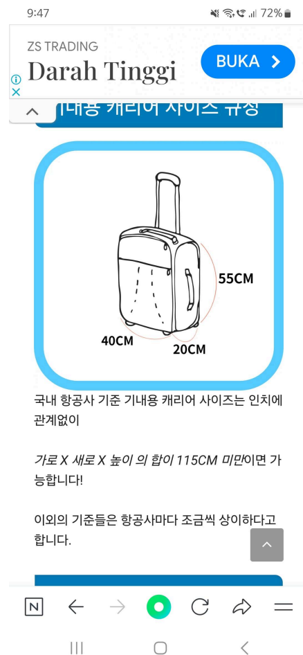
집 갈 준비, 캐리어 짐 싸기