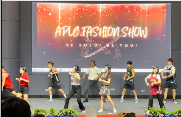
학교 축제 모습