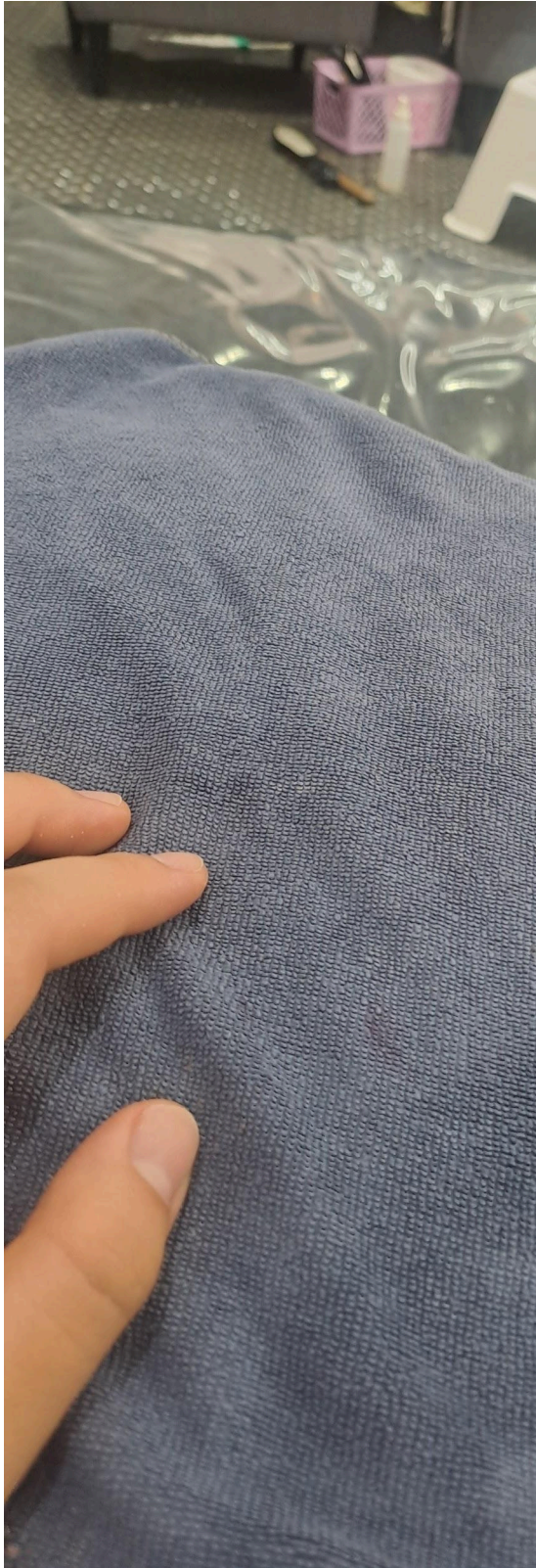
Ai nail spa