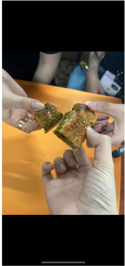
아랍 친구가 준 아랍 간식