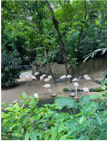
동물원에서 본 동물