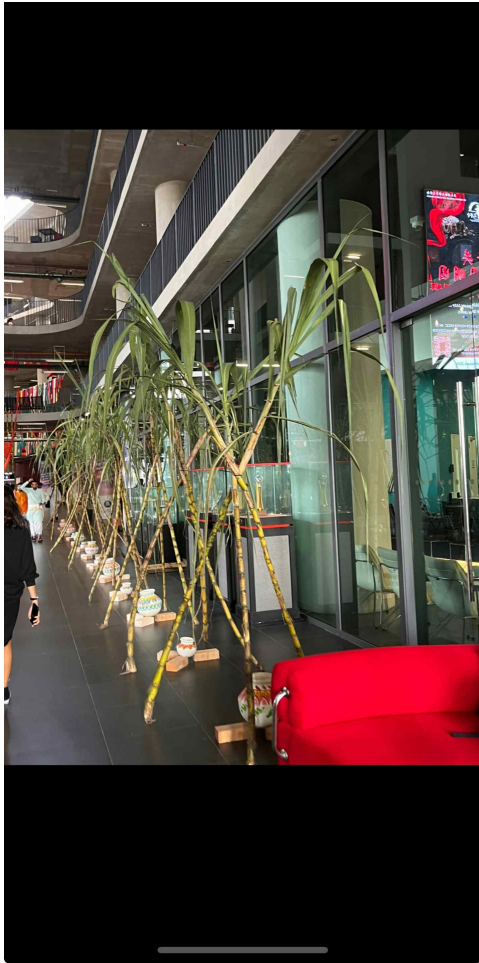
금요일 학교 모습