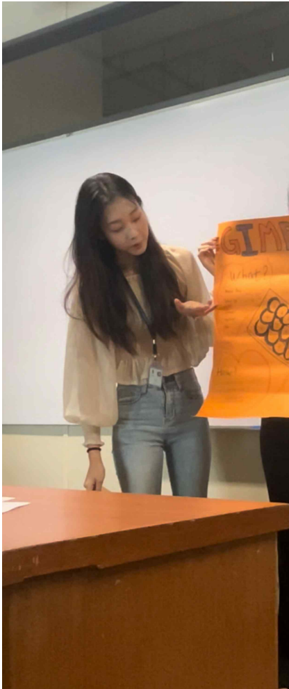
스피킹 테스트검 발표모습