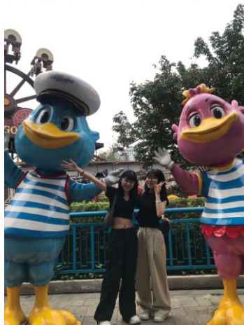
주말 일정. 선웨이 라군