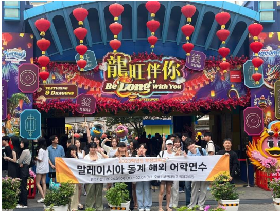
주말 일정. 선웨이 라군