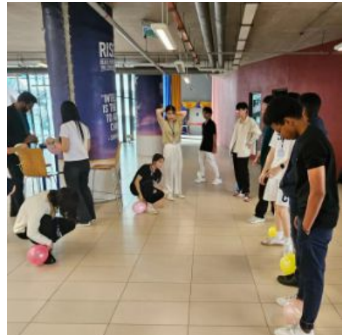
풍선안에 퀴즈가 있고 지는사람이 문제품