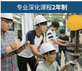
本校区工学馆3楼 032) 610-3310

取得资格证 土木产业技师、土木技师、建筑材料试验产业技师、建筑材料试验技师、测量及地形空间信息产业技师、测量及地形空间信息技师、建设安全产业技师、建设安全技师、混凝土技师和防灾技师等。