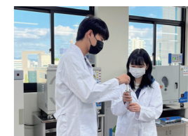
本校区韩吉馆6楼 032) 610-3320

根基产业培养专业优势 · 产业现场的优秀技术教育 · 获得韩国职业市场的竞争力 · 语言和文化学习 · 有望在韩国纤维、染色加工业领域就职