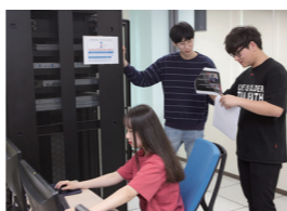
本校区梦之家9楼 032) 610-3260

取得资格证 信息安全产业技师、信息处理产业技师、网络管理师、Linux Master、信息保护专家(SIS)、国际公认信息系统审计师(CISA)、国际公认信息系统安全专家(CISSP)、网络基础资格(CCNA)、网络专业资格(CCNP)等。