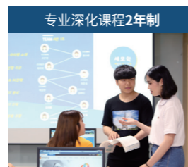
本校区梦之家7楼 032) 610-3460

取得资格证 计算机应用能力、AdsP（数据分析准专家）、电子商务管理师、电子商务运用师、电算会计、电算税务、电算会计运用师、FAT、TAT、信息处理技师和ERP信息管理师等。