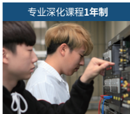
本校区韩吉馆4楼 032) 610-3400

取得资格证 电气产业技师、电气工程产业技师、电气铁路产业技师、消防设备产业技师、产业安全技师等 · 学士学位专业深化课程入学时，可参加技师资格证考试。