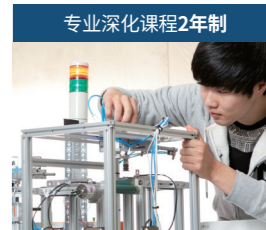
本校区韩吉馆2楼 032) 610-3340

取得资格证 电子(产业)工程师、电路设计产业工程师、嵌入式产业工程师、电子仪器产业工程师、生产自动化产业工程师、电子计算机控制产业工程师、半导体装备维护维修技师、信息通信(产业)工程师、信息通信设备工程师、信息处理产业工程师、电子计算机工程师、电波电子(产业)工程师、信息技术(产业)工程师、计量产业工程师。