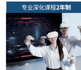
本校区韩吉馆4楼 032) 610-3470, 3474