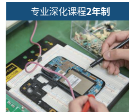
本校区梦之家12楼 032) 610-3360

取得资格证 · 网络领域: 信息通信产业技师、网络管理师、CCNP、CCIE、Linux Master等 · IoT实务领域: 信息处理产业技师、嵌入式技师、移动应用程序开发专家资格证等