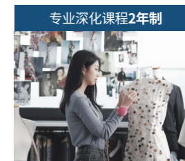
本校区韩吉馆6楼 032) 610-3320

取得资格证 纤维产业技师、纤维设计产业技师、染色技师、针织设计及设计CAD、GTQ(图形技术资格)、ITQ(信息技术资格)、色彩列表产业技师、时尚设计产业技师、时尚模特产业技师、技术设计师资格证、Shop Master资格证等。