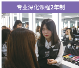
本校区千年馆4楼 032) 610-0660

取得资格证 • 国家资格证 ：美容师（化妆、皮肤、美甲、一般）资格证、彩妆师、定制型化妆品配方管理师 ※ 毕业时取得美容师综合执照 • 民间资格证 ：演出化妆师、美容造型师、医院造型师、个人色彩顾问、美容管理师、毛发学家、芳香疗法师、体型管理师（肥胖专门管理师）、Upstyle、婚礼策划人等