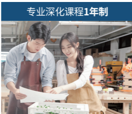
本校区工学馆4楼 032) 610-3300

取得资格证 建筑产业技师、建筑技师、建设安全产业技师、建筑设备产业技师、BIM技师、电算应用建筑制度技师等。