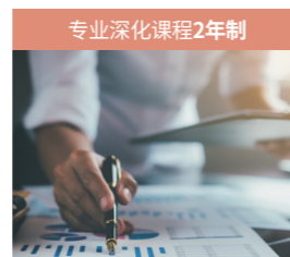
本校区韩吉馆6楼 032) 610-3420

取得资格证 • 经营相关资格证 : 经营指导师、经营诊断师、服务经营管理师、流通管理师、物流管理师、销售师、质量管理师、劳务师、ERP、贸易英语等 • 财务·会计相关资格证 : 证券分析师、投资咨询师、财务设计师、期货交易师、注册会计师、税务师、关税师、电算会计、电算税务师、FAT、TAT、会计信息师等 • 计算机相关资格证 : 计算机应用能力、ITQ、MOS、文字处理器、信息处理技师等