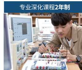
本校区韩吉馆2楼 032) 610-3340

取得资格证 (国家资格证) 智慧工厂产业工程师、自动化设备产业工程师、电子产业工程师、电气产业工程师、空压产业工程师、信息处理产业工程师、大数据分析工程师、(民间资格证) 智慧工厂专家1级/2级、智慧工厂运营管理师1级/2级、智能制造设计管理专业资格证1级/2级/3级，SQL专家(开发人员)。