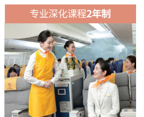
本校区千年馆2楼 032) 610-0840

取得资格证 外语相关资格证、航空预约出票、SMAT（服务经营资格）、CPR（心肺复苏术）、计算机应用能力1·2级、秘书资格1·2级、调酒师等。