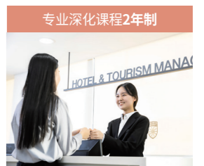
本校区梦之家10楼 032) 610-3280

取得资格证 • 旅行服务 : 旅游翻译导游（英语、日语、汉语）、航空预约及出票资格证、国内旅行导游、国外旅行领队等 • 酒店食品饮料服务 : 酒店管理师、酒店服务师、潮州技师、咖啡师等 • O/A实务 : 计算机应用能力、文字程序、电算税务会计师等