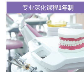
素砂校区教学楼3楼 032) 610-8380