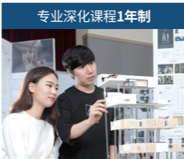
本校区工学馆2楼 032) 610-3330

取得资格证 室内建筑技师、室内建筑产业技师、色彩列表产业技师、电算应用建筑制度技师、计算机图形运用技师、Auto CAD技术资格1、2级、ITQ Excel信息技术资格证等。