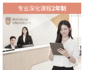
本校区梦之家5楼 032) 610-3430

取得资格证 秘书资格证、TOEIC、TOEIC SPEAKING、HSK、文字处理器、计算机应用能力、MOS、信息技术资格(ITQ)、ITPLUS、电算会计、电算税务、电算会计运用公司、FAT、TAT、ERP信息管理公司、SMAT（服务经营资格）等。