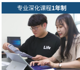
本校区梦之家6楼 032) 610-3450

取得资格证 信息处理产业技师、电子计算机组织应用产业技师、OCP(Oracle Certified Professional)、OCJP(Oracle Certified Java Programmer)、MCSE(Microsoft Certified System Engineer)等计算机相关资格证、办公自动化产业技师、计算机应用能力1、2级等。