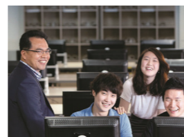
本校区梦之家3楼 032) 610-3250

取得资格证 • 电算会计1级，电算税务1·2级，税务会计1·2级（国家公共民间资格，韩国税务社会） • FAT 1级、TAT 1·2级（国家公民资格、韩国注册会计师协会） • 财经管理师、会计管理1级（国家公民资格、三一会计法人） • 注册会计师、税务师（国家专业资格、金融监督院、韩国产业人力公团）