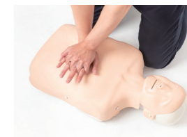
素砂校区教学楼5楼 032) 610-8420

取得资格证 1级急救救助师（韩国保健医疗人员国家试验院）、BLS-Provider（美国心脏协会发行）、BLS-Instructor（美国心脏协会发行）、应急处理院（大韩急救救助协会）、一般应急处理讲师1级（大韩急救救助协会）、获奖人命救助资格证（大韩红十字会）、专业应急处理讲师、灾难安全指导者。