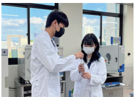
본캠퍼스 한길관 6층 032) 610-3320

장점 • 산업현장의 우수한 기술 교육 • 한국 직업 시장에서의 경쟁력 획득 • 언어와 문화 습득 • 한국 섬유, 염색가공업 분야 기업에 취업 가능