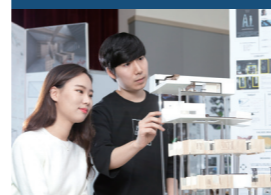
본캠퍼스 공학관 2층 032) 610-3330