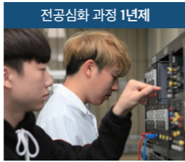
전공심화 과정 1년제 본캠퍼스 한길관 4층 032) 610-3400

취득자격증 • 전기산업기사, 전기공사산업기사, 전기철도 산업기사, 소방설비산업기사, 산업안전산업기사 등 • 학사학위 전공심화과정 입학 시 기사 자격증 시험 응시 가능