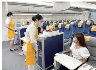
전공 체험 프로그램