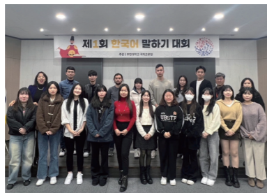
한국어 말하기 대회