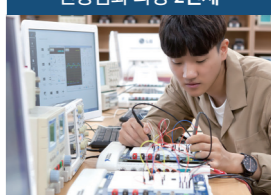
본캠퍼스 한길관 2층 032) 610-3340