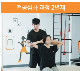
본캠퍼스 몽당기념관 1층 032) 610-3490

재활스포츠과는 실무형 전공지식과 숙련된 전공실기 기능을 갖춰 운동재활 관련 업무에 즉시 투입 될 수 있는 메디컬 트레이너, 퍼스널 트레이너 양성을 교육 목표로 노력하고 있습니다.