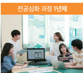
본캠퍼스 한길관 5층 032) 610-3380

디지털미디어디자인학과는 체계적인 기초 디자인 교육을 시작으로 비주얼 커뮤니케이션(시각디자인), 사용자경험디자인(UX), 사용자인터페이스디자인(UI), 모션그래픽, AR, VR 등의 교육을 통하여 어떠한 디지털 매체 환경의 변화에도 대처할 수 있는 융·복합형 디지털 콘텐츠 디자이너를 양성합니다.