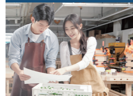
본캠퍼스 공학관 4층 032) 610-3300