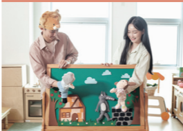
소사캠퍼스 강의동 9층 032) 610-8330