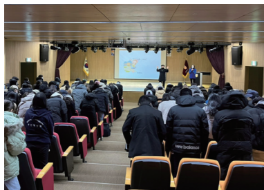
외국인 유학생 대상 취업 컨설팅 및 지원 프로그램