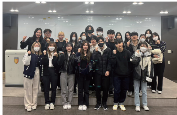
언어교류스터디(영어, 중국어, 일본어)