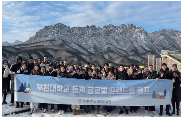
글로벌 프렌드십 캠프