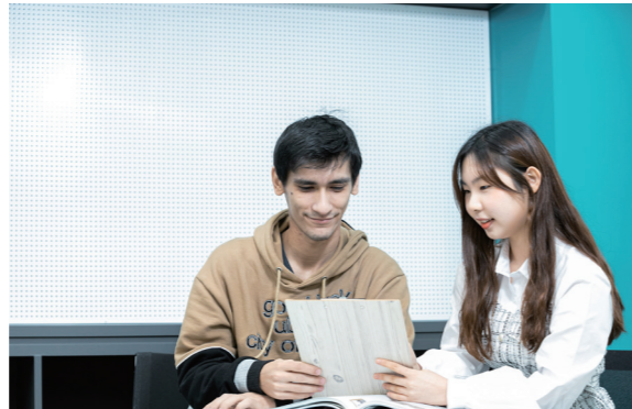
B.G.M(Bucheon Global Mentoring)