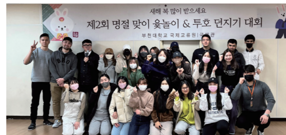
명절 맛이 웃놀이 & 투호 던지기 대회