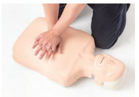
소사캠퍼스 강의동 5층 032) 610-8420

취득자격증 1급 응급구조사(한국보건 의료인국가시험원), BLS -Provider(미국심장협회발행), BLS-Instructor(미국심장협회발행), 응급처치원(대한응급구조협회), 일반응급처치강사1급(대한응급구조협회), 수상인명구조 자격증(대한적십자사), 전문응급처치강사, 재난안전지도자