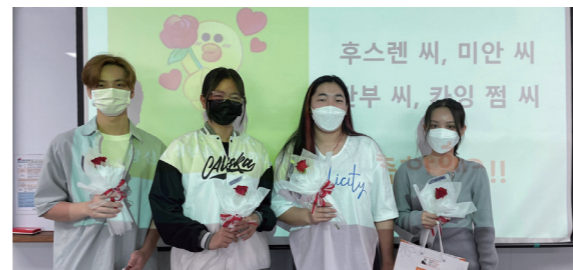
한국 성년의 날