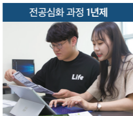
전공심화 과정 1년제 본캠퍼스 꿈집 6층 032) 610-3450

취득자격증 정보처리산업기사, 전자계산기조직응용산업기사, OCP(Oracle Certified Professional), OCJP(Oracle Certified Java Programmer), MCSE(Microsoft Certified System Engineer) 등 전산 관련 자격증, 사무자동화 산업기사, 컴퓨터활용능력 1·2급 등