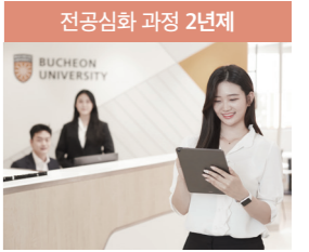
본캠퍼스 품집 5층 032) 610-3430

취득자격증 비서자격증, TOEIC, TOEIC SPEAKING, HSK, 워드프로세서, 컴퓨터활용능력, MOS, 정보기술 자격(ITQ), IT PLUS, 전산회계, 전산세무, 전산회계운용사, FAT, TAT, ERP정보관리사, SMAT(서비스경영자격) 등