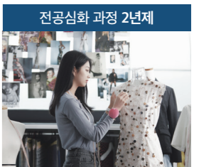
전공심화 과정 2년제 본캠퍼스 한길관 6층 032) 610-3320

취득자격증 섬유산업기사, 섬유디자인산업기사, 염색기능사, 니트디자인 및 설계 CAD, GTQ(그래픽기술자격), ITQ(정보기술자격), 컬러리스트 산업기사, 패션디자인산업기사, 패션머천다이징산업기사, 테크니컬디자이너 자격증, 샵마스터 자격증 등