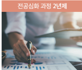
본캠퍼스 한길관 6층 032) 610-3420

취득자격증 • 경영 관련 자격증 : 경영지도사, 경영진단사, 서비스경영관리사, 유통관리사, 물류관리사, 판매사, 품질관리사, 노무사, ERP, 무역영어 등 • 재무·회계 관련 자격증 : 증권분석사, 투자상담사, 재무설계사, 선물거래사, 공인회계사, 세무사, 관세사, 전산회계, 전산세무, FAT, TAT, 회계정보사 등 • 전산 관련 자격증 : 컴퓨터활용능력, ITQ, MOS, 워드프로세서, 정보처리기사 등