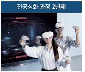
전공심화 과정 2년제 본캠퍼스 한길관 4층 032) 610-3470, 3474