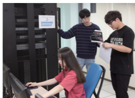
본캠퍼스 꿈집 9층 032) 610-3260

취득자격증 정보보안산업기사, 정보처리산업기사, 네트워크관리사, 리눅스마스터, 정보보호전문가(SIS), 국제공인정보시스템감사사(CISA), 국제공인정보시스템보안전문가(CISSP), 네트워크기초자격(CCNA), 네트워크전문자격(CCNP) 등