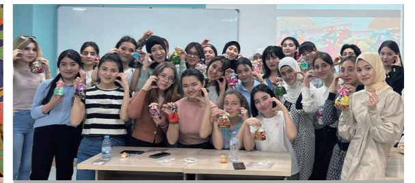
온라인 문화체험(한복 방향제 만들기)