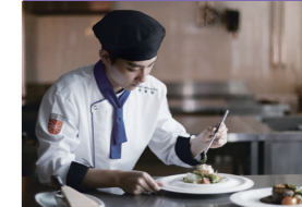
본캠퍼스 예지관 2층 032) 610-0810