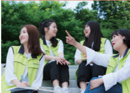
본캠퍼스 몽당기념관 3층 032) 610-0670