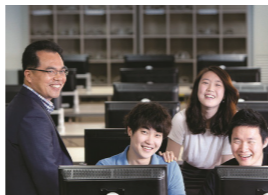
본캠퍼스 품집 3층 032) 610-3250

취득자격증 • 전산회계 1급, 전산세무 1·2급, 세무회계 1·2급(국가공인민간자격, 한국세무사회) • FAT 1급, TAT 1·2급(국가공인민간자격, 한국공인회계사회) • 재경관리사, 회계관리 1급(국가공인민간자격, 삼일회계법인) • 공인회계사, 세무사(국가전문자격, 금융감독원, 한국산업인력공단)