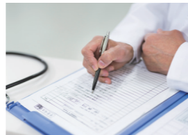
본캠퍼스 꿈집 4층 032) 610-0830

취득자격증 병원행정사 보건의료정보관리사, 병원코디네이터, 건강보험사, 보험심사평가사, 손해사정사 및 ITQ, MOS, ICDL, 컴퓨터활용능력, 전산회계 등