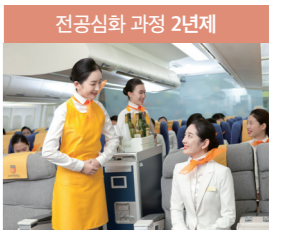
본캠퍼스 밀레니엄관 2층 032) 610-0840

취득자격증 외국어 관련 자격증, 항공예약 발권, SMAT(서비스경영자격), CPR(심폐소생술), 컴퓨터활용능력 1·2급, 비서 자격 1·2급, 조주사 등