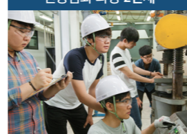
본캠퍼스 공학관 3층 032) 610-3310