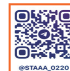
텔레그램 (우즈베키스탄, 러시아)