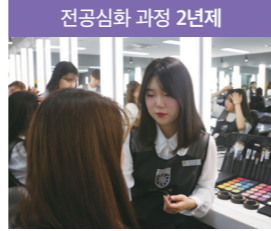
전공심화 과정 2년제 본캠퍼스 밀레니엄관 4층 032) 610-0660

취득자격증 • 국가자격증 : 미용사(메이크업, 피부, 네일, 일반) 자격증, 컬러리스트 산업기사, 맞춤형 화장품 조제관리사 ※ 졸업시 미용사 종합 면허증 취득 • 민간자격증 : 공연분장사, 뷰티스타일리스트, 병원코디네이터, 퍼스널컬러컨설턴트, 뷰티매니지먼트, 트리콜로지스트, 아로마테라피스트, 체형관리사(비만전문관리사), 업스타일, 웨딩 플래너 등