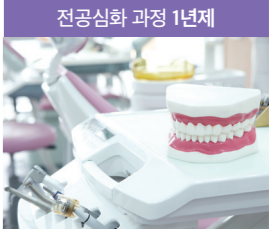
전공심화 과정 1년제 소사캠퍼스 강의동 3층 032) 610-8380