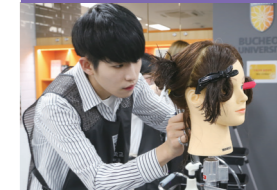
본캠퍼스 밀레니엄관 4층 032) 610-0660