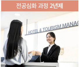
본캠퍼스 품집 10층 032) 610-3280

취득자격증 • 여행서비스 : 관광통역안내사(영어, 일본어, 중국어), 항공예약 및 발권 자격증, 국내여행안내사, 국외여행인솔자 등 • 호텔 식음료서비스 : 호텔관리사, 호텔서비스사, 조주기능사, 바리스타 등 • O/A실무 : 컴퓨터활용능력, 워드프로세서, 전산세무회계사 등