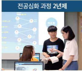
본캠퍼스 품집 7층 032) 610-3460

취득자격증 컴퓨터활용능력, ADSP(데이터분석 준전문가), 전자상거래관리사, 전자상거래운용사, 전산회계, 전산세무, 전산회계운용사, FAT, TAT, 정보처리기사, ERP정보관리사 등