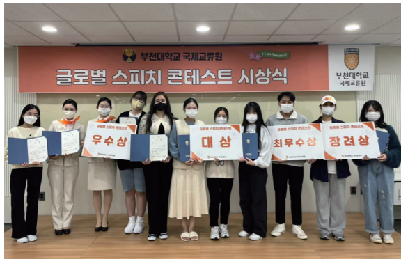
글로벌 스피치 콘테스트