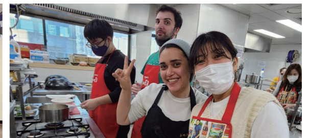
한국음식 만들기(떡국, 산적)