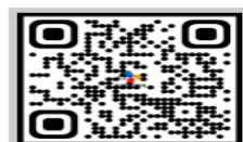
채용 관련 FAQ