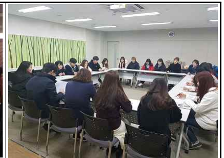
국가 교육근로장학생 간담회