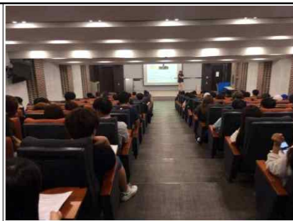
안전사고 예방 교육