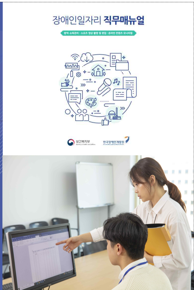
장애인일자리 신규 직무 및 매뉴얼 개발