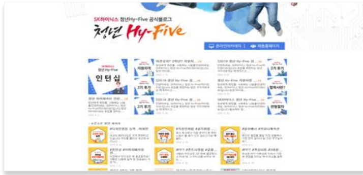
공식 블로그 (네이버)