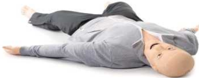
(상,하체 연결된 시뮬레이터 마네킹 사진)