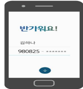
본인 확인 및 계좌개설