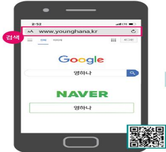
영하나 검색 or QR코드 스캔