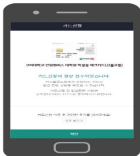
학생증카드 발급 신청 완료