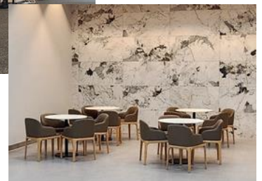
▶ 1층 로비 휴게공간