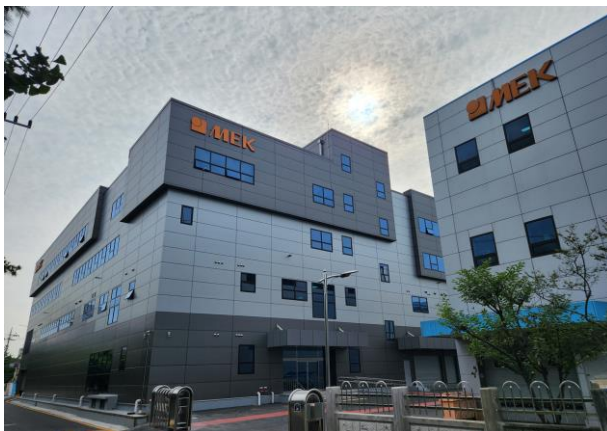
▶ 회사 전경