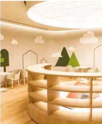
키즈존 Kids Zone