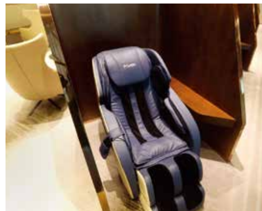
마사지 존 Massage Zone