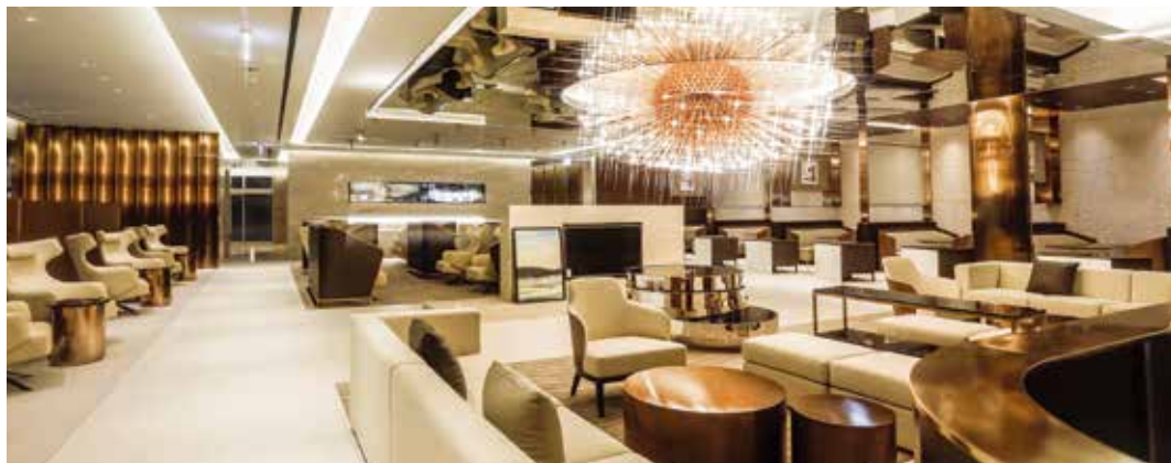
다이닝 존 Dining Zone

다이닝, 비즈니스, 마사지 존으로 구성된 142개 좌석과 3개의 프라이빗 비즈니스 PDR이 있으며 전용 화장실과 샤워실을 갖추고 있습니다.