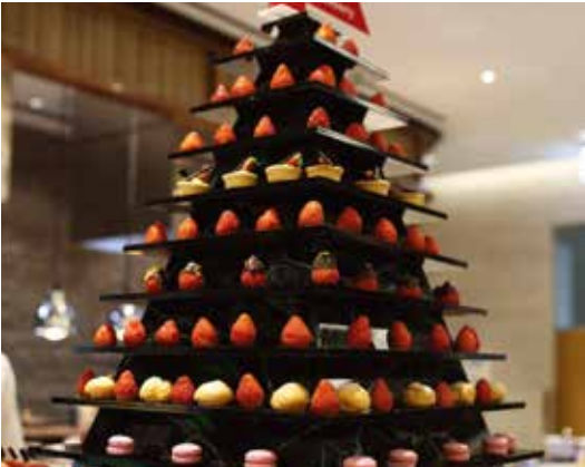
세미 뷔페 Semi Buffet

호텔 셰프가 조리하는 워커힐의 DNA가 담긴 시그니처 메뉴와 즉석요리는 마티나 골드의 자랑입니다.