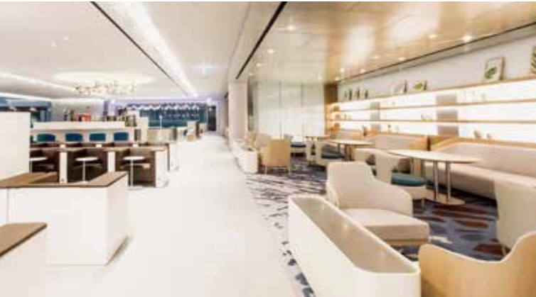
다이닝존 Dining Zone

201개의 좌석과 독서를 할 수 있는 라이브러리 존, 아이들을 위한 키즈존, 좋은 음질의 음악을 들을 수 있는 하만카돈 헤드셋이 준비되어 있습니다.