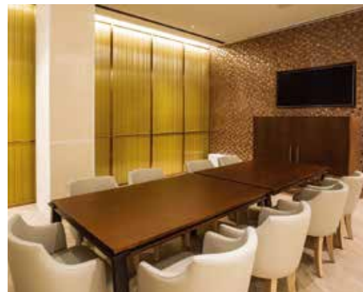
프라이빗 비즈니스 룸 Private Business Room