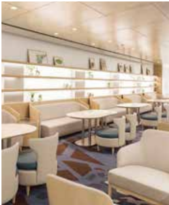
라이브러리존 Library Zone