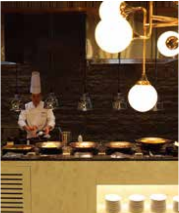
라이브 스테이션 Live Station