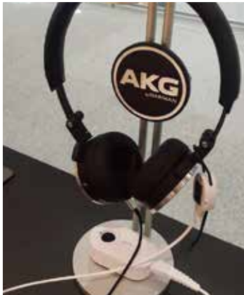
하만카돈 헤드셋 Harman kardon Headset