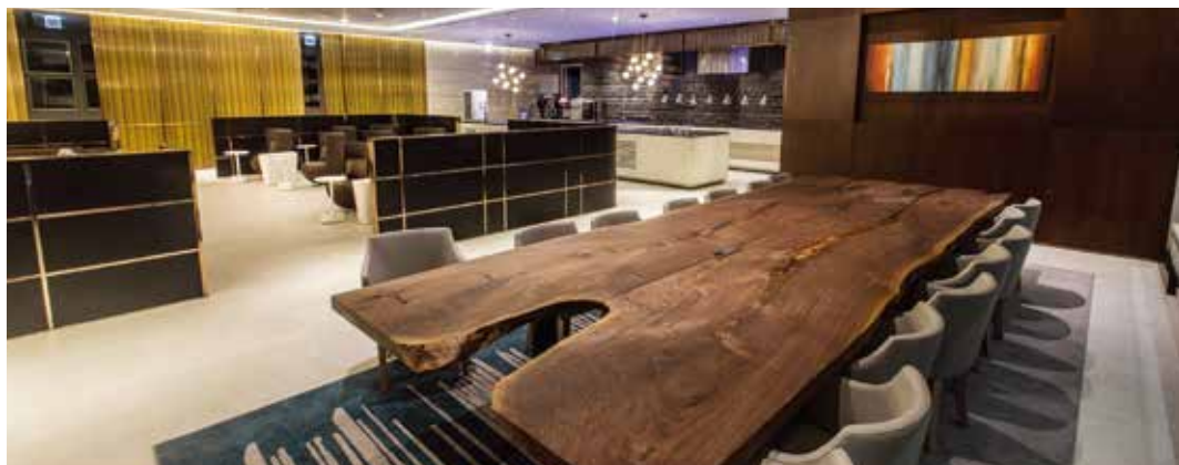
패밀리 다이닝 존 Family Dining Zone