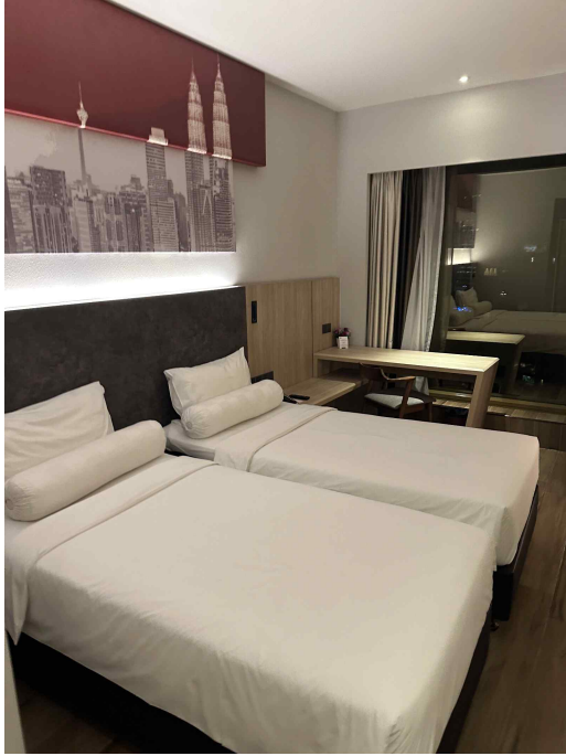
기숙사/ 호텔 등